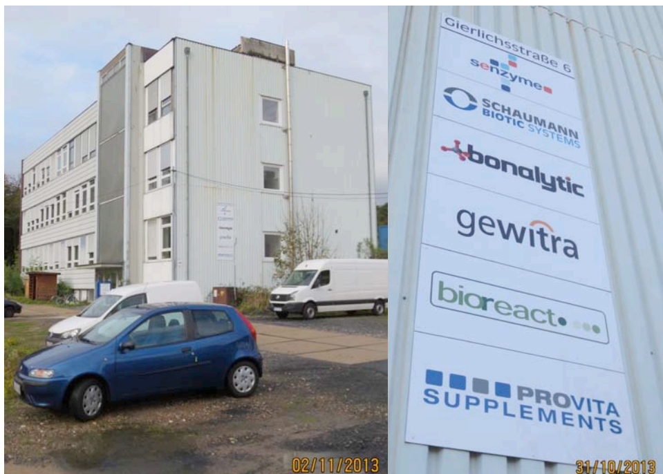
Aus Geb. 150 wird „Gierlichsstr. 6“

Und nun wird also das ehemalige Analytik-Geb. 159 „Gierlichsstr. 6“ genannt.