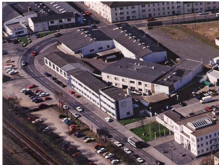
Die Kunststoff Technik Troisdorf in der Poststraße 115 (etwa 1994)

Erlauben Sie mir den Hinweis und die Bitte, ähnliche geschichtlichen Unterlagen aus Ihrem Besitz bei Bedarf und Interesse uns für unsere Stiftung „Troisdorfer Museum für Stadt- und Industriegeschichte“ zu übergeben.